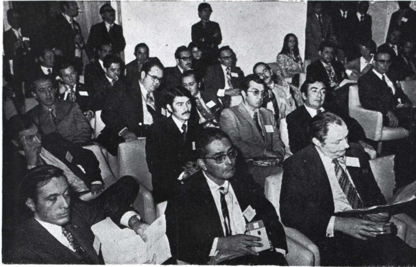
Aspecto general de la sala